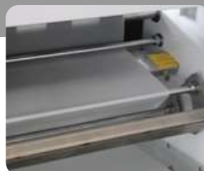
Πρώθηση με αυτόματο 'τέντωμα' υλικού