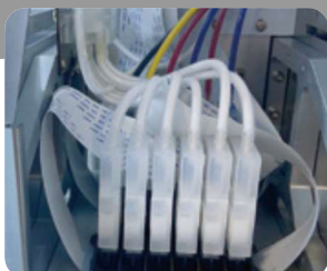
2 κεφαλές εκτύπωσης - CMYK+W