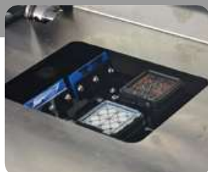
2 κεφαλές i1600 (2x1600 ακροφύσια)